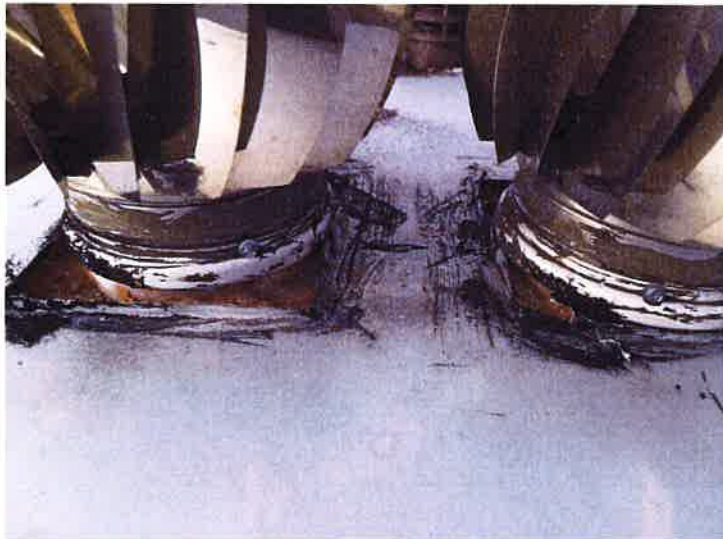
Fot. 11 Obróbka nasad kominowych.