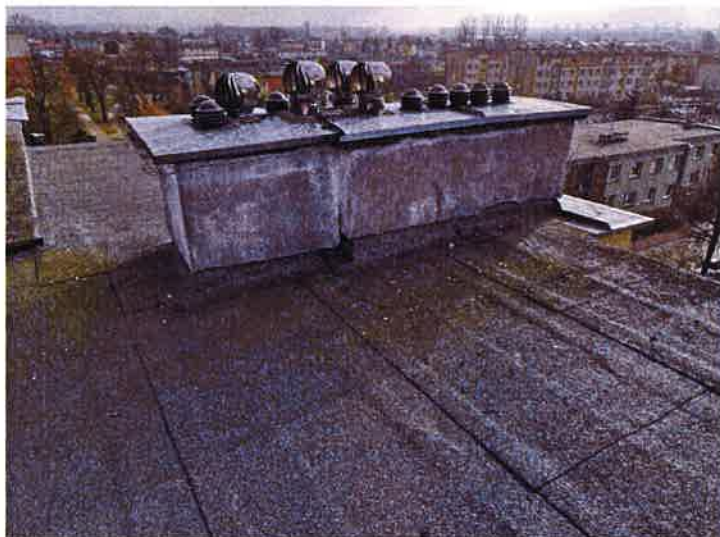
Fot. 9 Widok kominów.