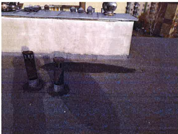
Fot. 8 Widok kominów.