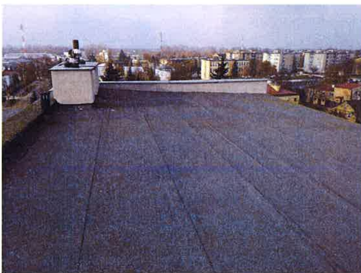
Fot. 4 Widok dachu.