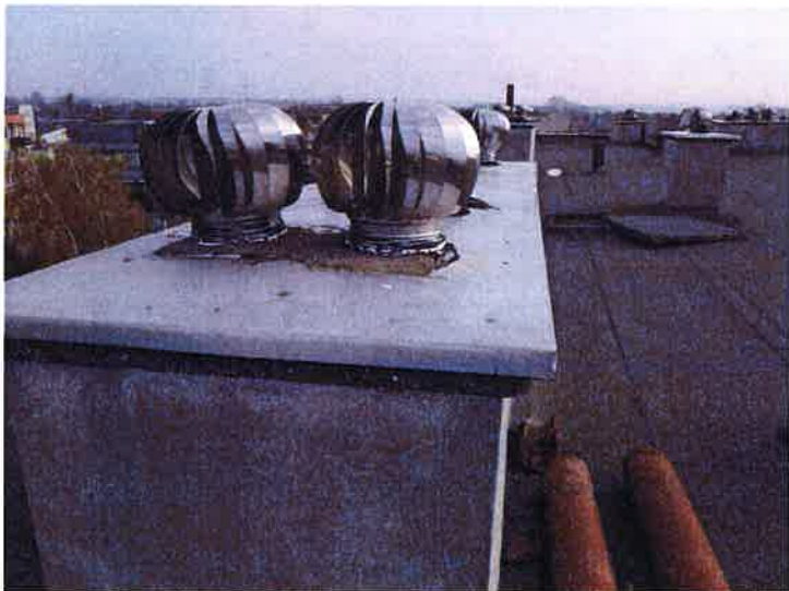
Fot. 12 Obróbka nasad kominowych.