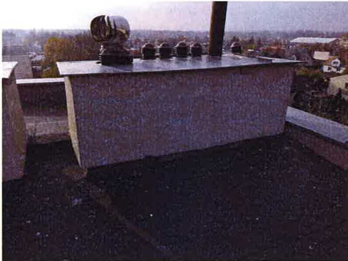
Fot. 5 Widok kominów.