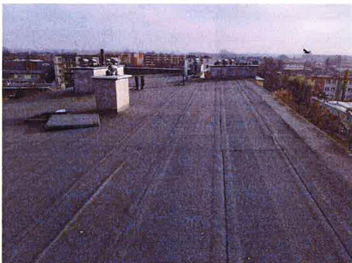
Fot. 3 Widok dachu.