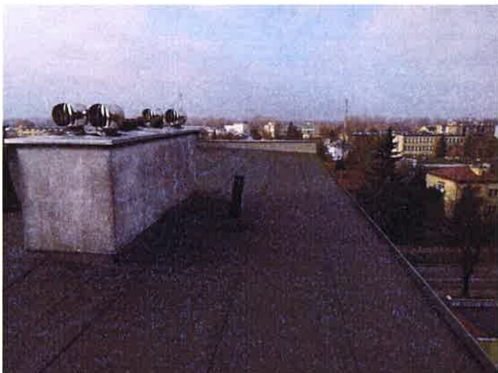
Fot. 1 Widok dachu.