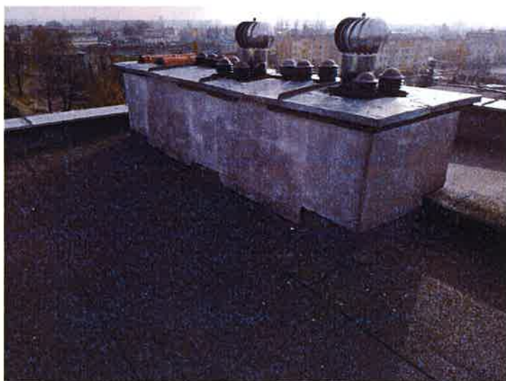
Fot. 10 Widok kominów