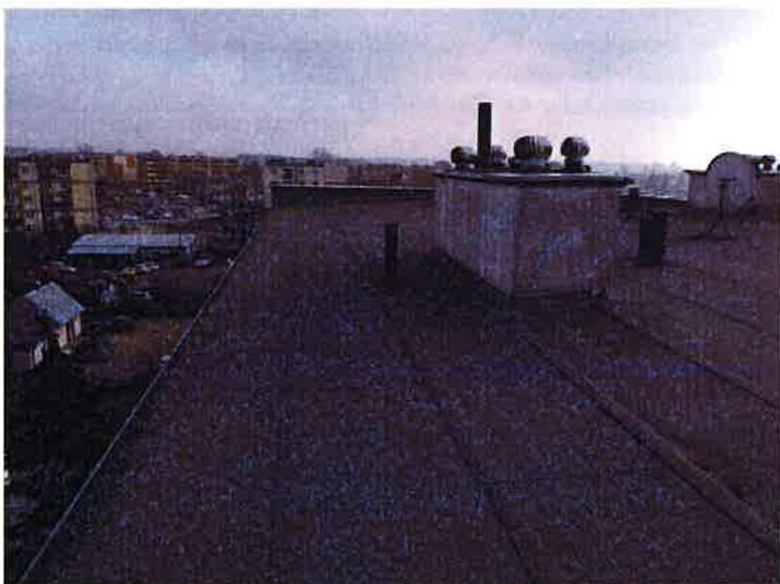
Fot. 2 Widok dachu.