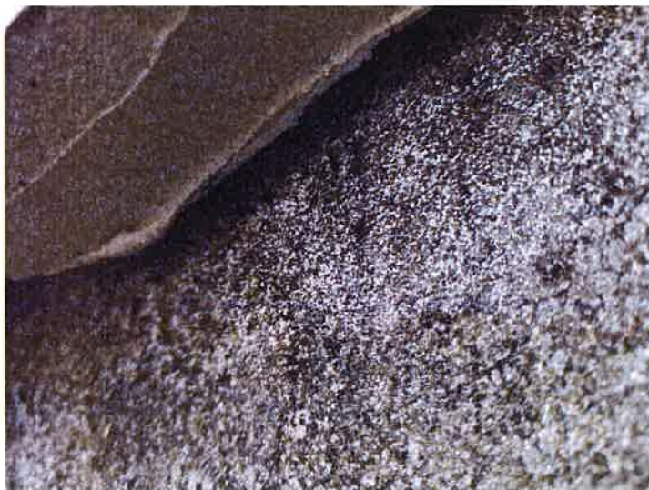
Fot. 6 Połączenie komin z połącją dachową.