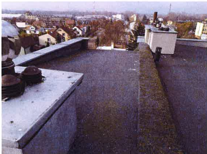
Fot. 7 Widok dachu.